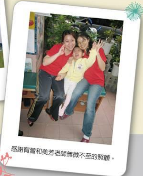
感謝育萱和美芳老師無微不至的照顧。