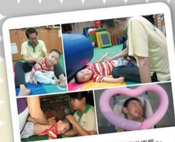
感謝北區兒童發展中心伴我喜悅成長~