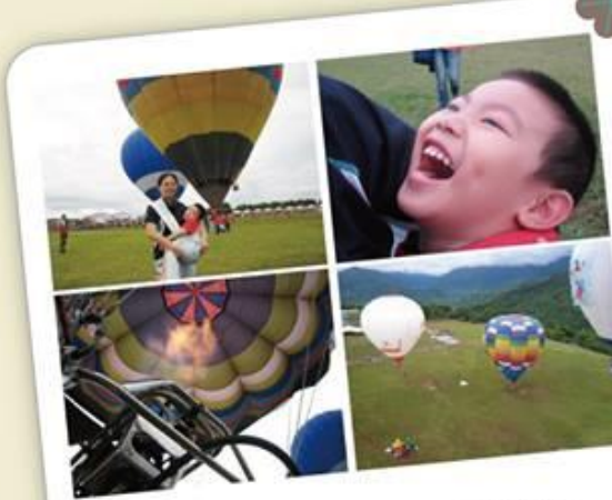
突破困難，乘著風，遨遊天際去飛翔。